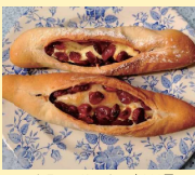
クラベリーチーズ 200円

住宅街にある、お庭の素敵なパティシエさん。クラベリークリームチーズ、はちみつが程よくマッチするパンを1日6個の数量限定でご提供。