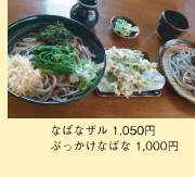
なばなずル 1,050円 ぶっかけなばな 1,000円

菜の花を食べやすい天ぷらにじがなばなを。そのまの味を楽しめる「ふっかけなばな」をご用意。徳田内産菜を100%使用した石臼挽きの手打ち麺と出汁の利いたタレがよく合います。