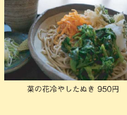
菜の花冷やしめき 950円

菜の花の天ぷらとチリメンをトッピングしたそばをたっぷり使ったピザにベストマッチの菜の花はちみつがトッピングされた一品です。菜60年以上の古民家でゆったりとした時間を楽しみながらどうぞ。