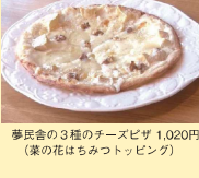
夢民舎の3種類のチーズピザ 1,020円 (菜の花はちみつトッピング)

「夢民舎」運営のレストラン3種類のチーズをたっぷり使ったピザにベストマッチの菜の花はちみつがトッピングされた一品です。