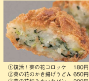
①復活！菜の花コロッケ 180円 ②菜の花のかけ揚げうどん 650円 ③菜の花細みたいパン 200円

期間限定の菜の花メニューをご用意。かつての大人気テイクアウトメニュー「菜の花コロッケ」が復活します！