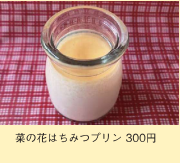
菜の花はちみつプリン 300円

☎0145-25-4138 ☎ 安平町追分白樺 1-389 ☎ 毎週土曜日 11:00~17:00